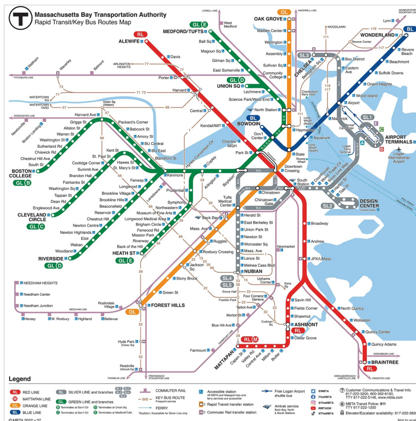
Mapa de la MBTA